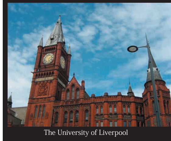
The University of Liverpool