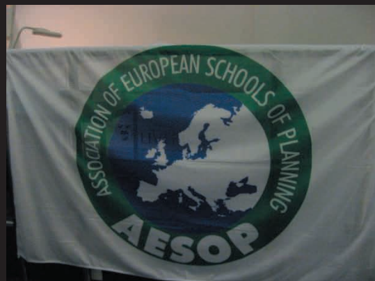
Association of European Schools of Planning