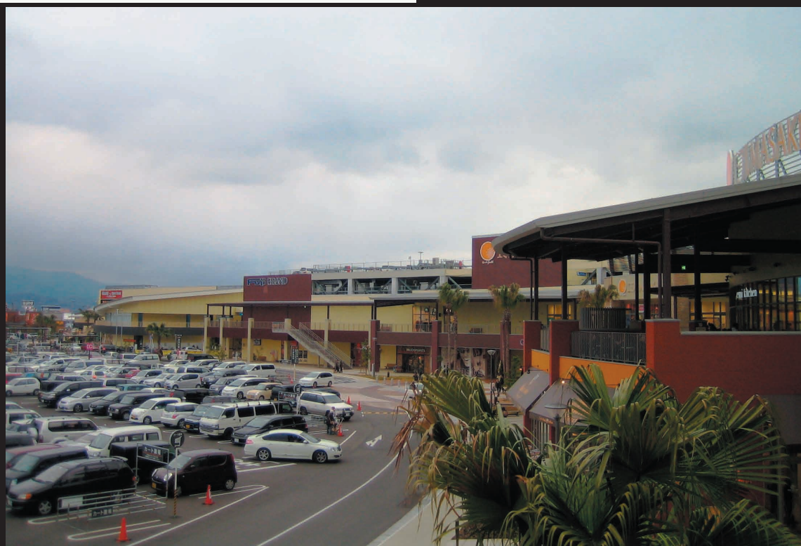
松山郊外に完成した大型ショッピングモール（2009年1月1日撮影）