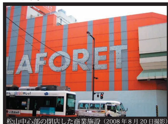
松山中心部の閉店した商業施設（2008年8月20日撮影）

推進する青森市等の先進自治体の政策が、松山市に波及したものとしても理解可能かもしれません。自治体間の政策波及において生じる、相互参照の概念（伊藤修一郎『自治体発の政策革新』（木鐸社、2006））によれば、自治体は政策決定に伴う不確実性を減らすため、先進自治体の政策を参照しますが、単に引き写すのではなく、新工夫を加えたり、複数の先進自治体の政策から良い部分だけ移転したり、あるいは先進自治体の政策の発想のみをヒントにして、自前の政策手段を導入すると言われています。「松山は松山。」であるために、どのような相互参照が行われているのか、研究したいと思っています。