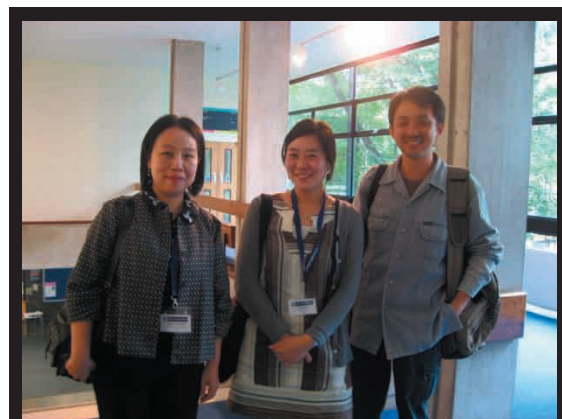
Met Seniors who graduate UT

I met a lot of student and scholar and exchange our idea through this conference. It makes me motivation to fix my research topic more strongly. Moreover, I recognized where I am and what I should do during my PhD course.